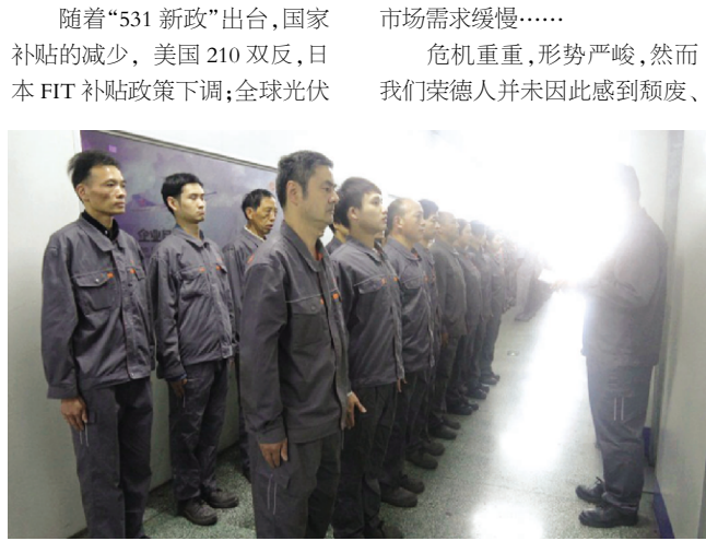
随着“531 新政”出台,国家补贴的减少, 美国 210 双反, 日本 FIT 补贴政策下调;全球光伏